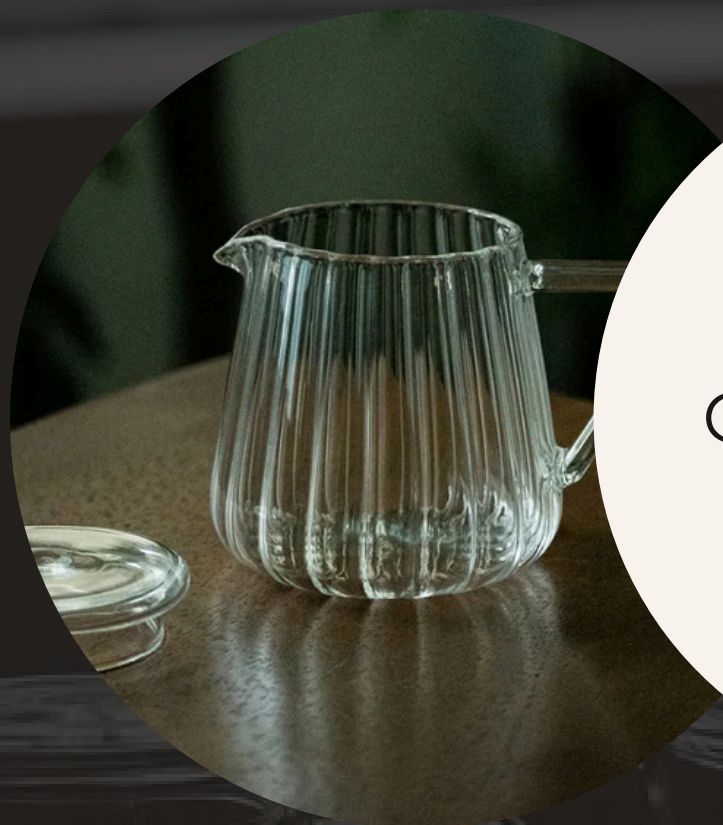
Optic Glass Jug