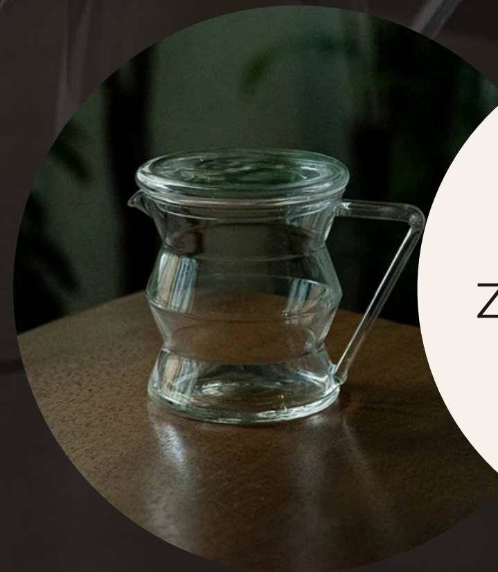
ZigZag Glass Jug