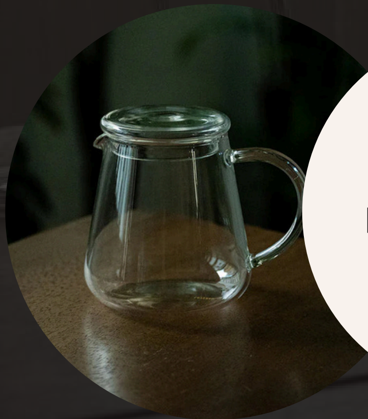
Belly Glass Jug

Поставляются без крышек- можно приобрести отдельно