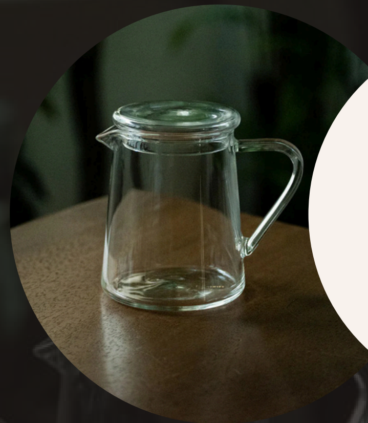
Tall Glass Jug