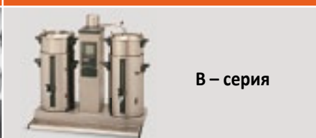
В – серия