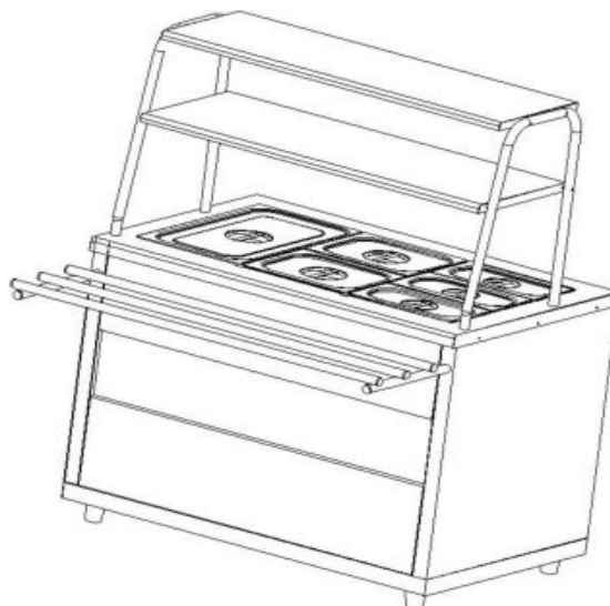
Рис.1 Общий вид мармита МЭП-2Б/ЛП и МЭП-2Б/ЛПЭ

Общий вид мармита представлен на рис. 1. В серии «Лира-Профи» корпус мармита изготовлен из нержавеющей стали, в серии «Лира-Профи Эко» отдельные элементы изготовлены из окрашенной оцинкованной стали. В столешницу мармита встроена прямоугольная ванна с электронагревательными элементами.