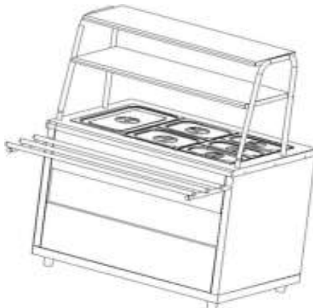
Рис.1 Общий вид мармита МЭП-2Б-П/ЛП, МЭП-2Б-П/ЛПЭ

Общий вид мармита представлен на рис. 1. В серии «Ли́ра-Профи» корпус мармита изготовлен из нержавеющей стали, в серии «Ли́ра-Профи Э́ко» отдельные элементы изготовлены из окрашенной оцинкованной стали. В столешницу мармита встроена прямоугольная паровая ванна с электронагревательными элементами.