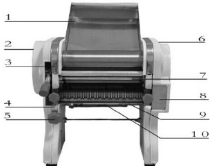
Рис 1: Фронтальная сторона машины