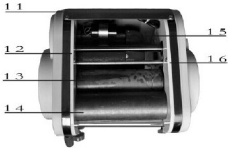
Рис 2: Вид сверху