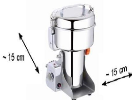
Рис.4 – Регламентированная установка оборудования (размещение на рабочей поверхности) до сторонних предметов или стен.

Необходимое пространство для эксплуатации. Указаны предельные расстояние до соседнего оборудование или стен помещения. Рис. 4