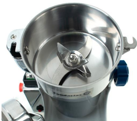
Рис2. Режущее устройство (нож 3х ярусный)