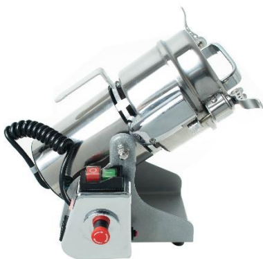
Рис3 Наклоняющийся корпус, с зажимным устройством (для удобной выгрузки, а также для измельченного продукта)