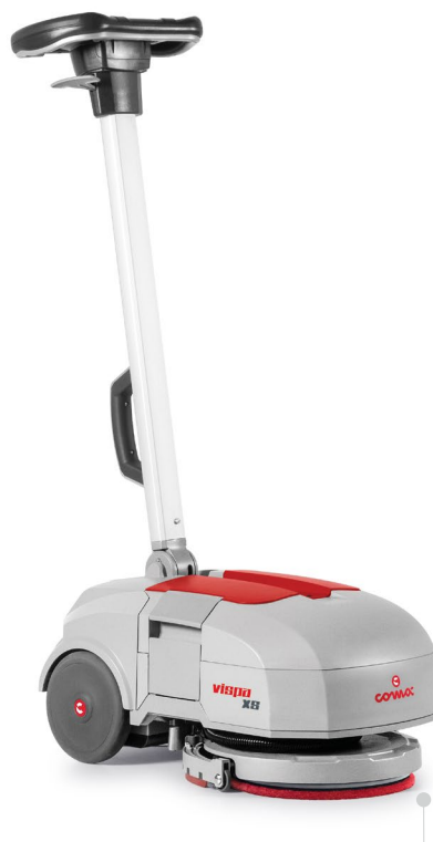
VISPA XS Версия с дисковой щеткой или с падом