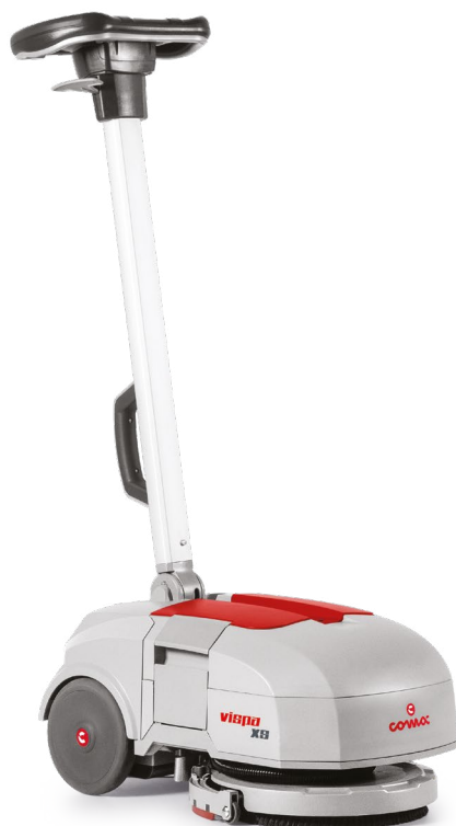
VISPA XS Версия с щеткой