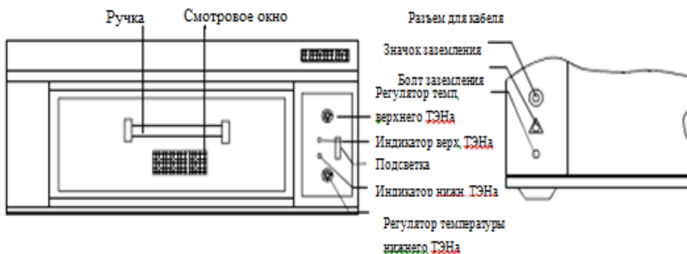
Рис 1. Основные органы управления. Рисунок представлен на одноярусную печь

Электрическая печь ярусная серии НЕО имеет корпус, изготовленный из нержавеющей стали и утепленный современными теплоизоляционными материалами. Дверь печи снабжена стеклянными окнами для наблюдения за продуктом. Печь разделена на ярусы (двух- и трёхъярусные) с двумя противнями, каждый ярус имеет индивидуальный контроль температуры.