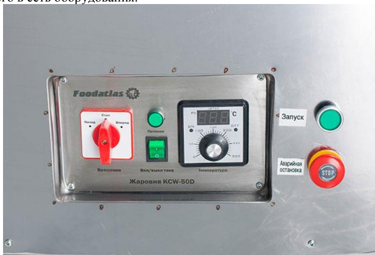
Рис2. Панель управления. основные органы управления оборудованием

Запрещается класть на поверхность оборудования любые предметы, находиться 12 посторонним лицам вблизи работающего оборудования, осматривать механизмы включенного в сеть оборудования.