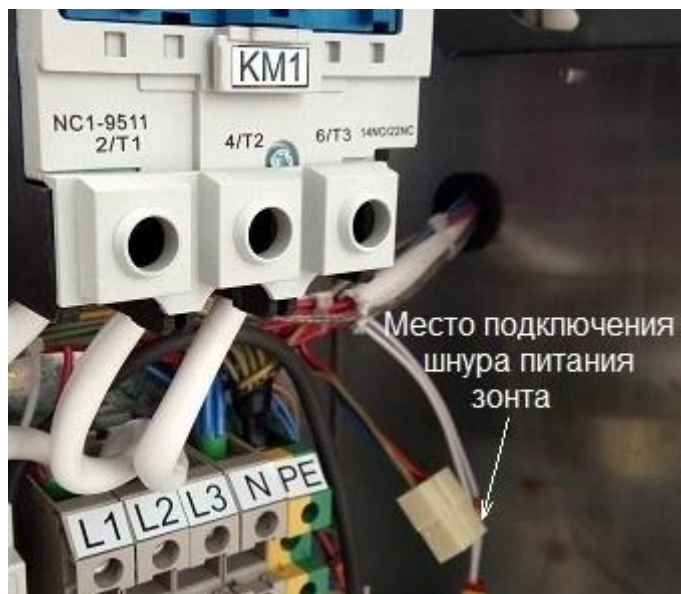
Рис.1 Подключение шнура питания зонта к колодке 45.7373.9005 пароконвектомата

Номинальное поперечное сечение шнура питания не должно быть меньше значений, указанных в таблице 3.