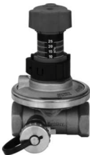
АРТ DN 15-50