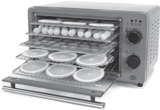
Рисунок 2: Сушилка для фруктов, овощей и трав, 14 л с сухофруктами