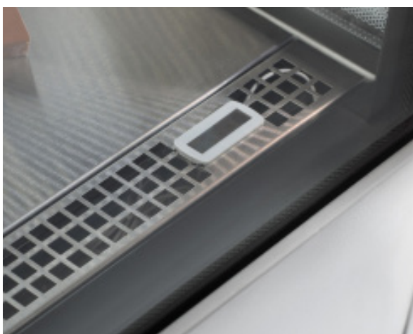
Стабильное поддержание температуры по всему объему и оптимальные условия хранения