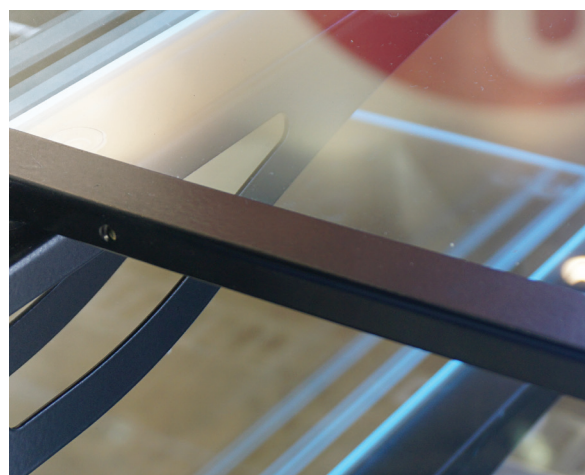
Возможность регулирования угла наклона полки