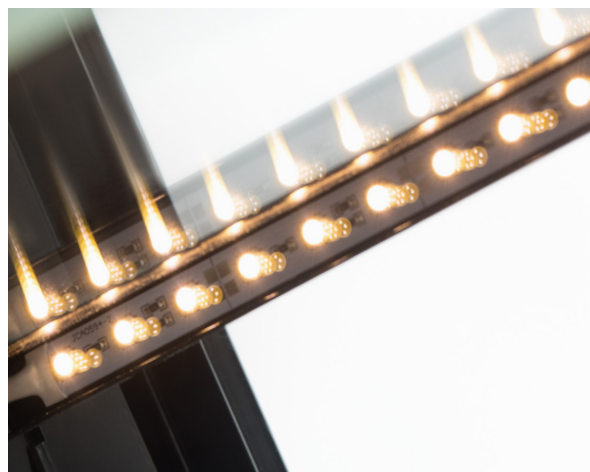
LED-подсветка экспозиции: полок и внутреннего пространства