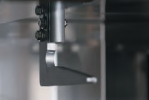
вращение с помощью крюка