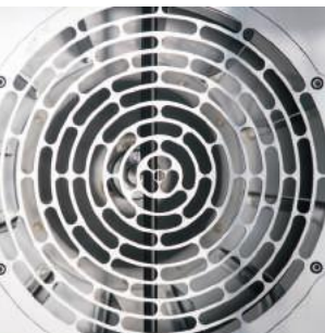
оптимальный воздушный поток