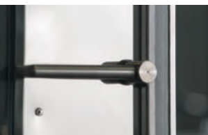
рукоятка внутри печи для безопасности