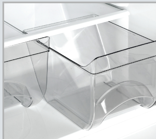
Два сосуда для овощей и фруктов