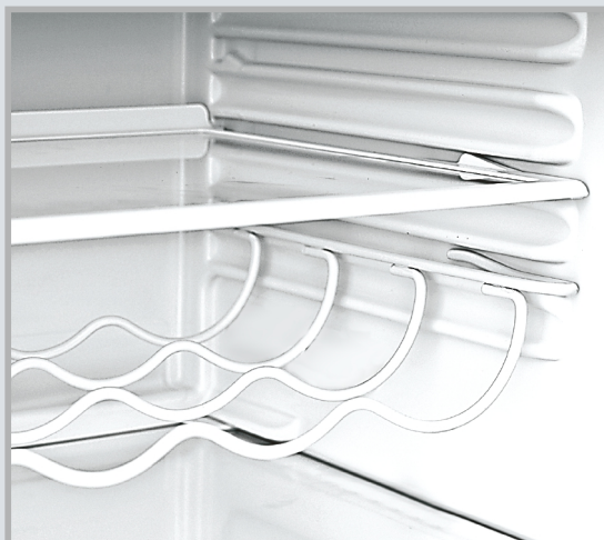
Переставляемая полка для бутылок