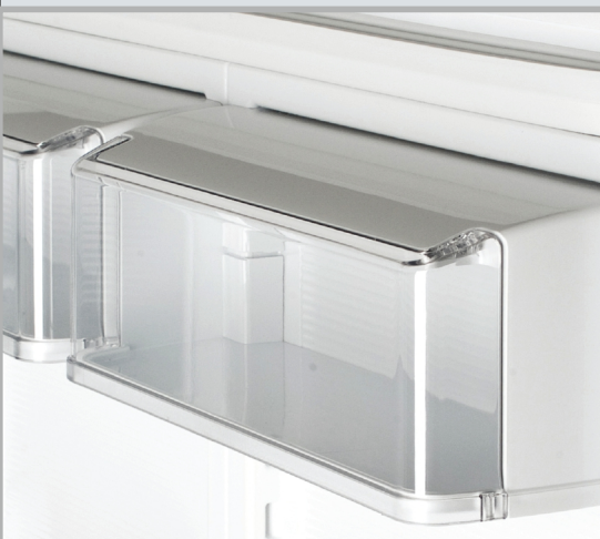
Две ёмкости с крышкой

ЭЛЕМЕНТЫ УПРАВЛЕНИЯ И КОМФОРТНОСТИ В ХОЛОДИЛЬНОЙ КАМЕРЕ