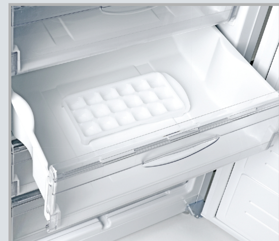
Корзина с формой для льда

Ролик регулировки температуры в морозильной камере