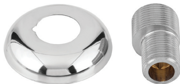
Отражатель с эксцентриком для ПС «Стилье» арт. 00100-3400