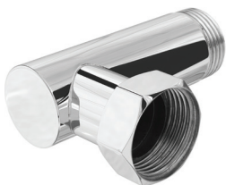
Уголок переходной G 1" НР × 1" НГ арт. 02002-0110