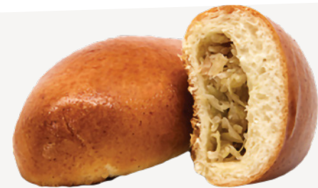
Пирожок с капустой