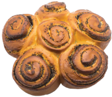
Ромашка с маком