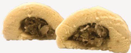
Пян-Се по Сеульски