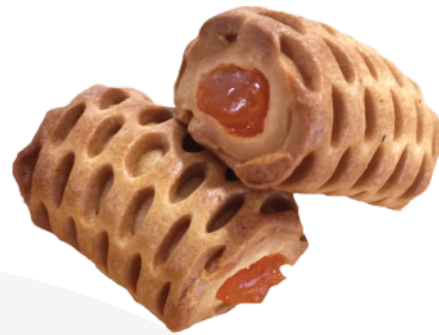
Булочка с начинкой