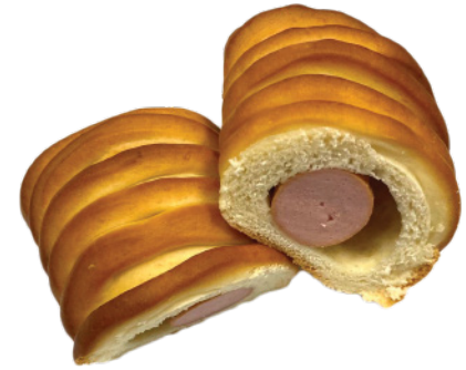
Сосиска в тесте