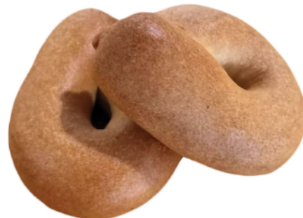
Бублик с начинкой