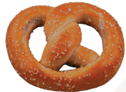
Крендель с начинкой