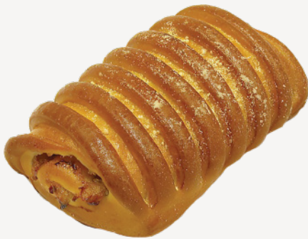
Сдобная булочка с декорацией