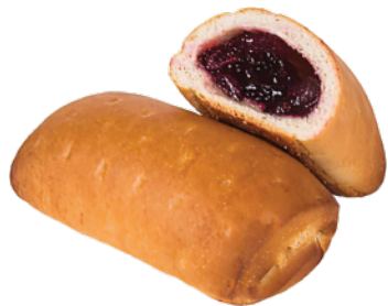
Пирожок с джемом