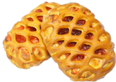
Пирожок с декорацией