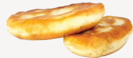
Жареный пирожок с начинкой