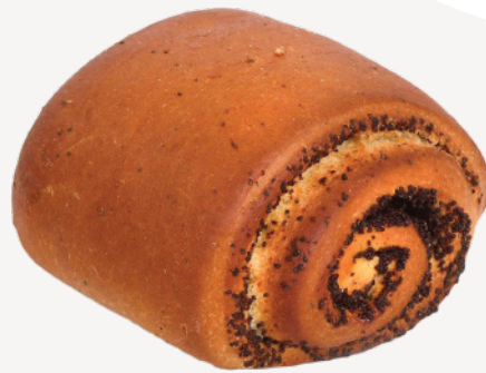
Рулет с маком