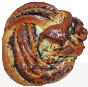
Завитушка с маком