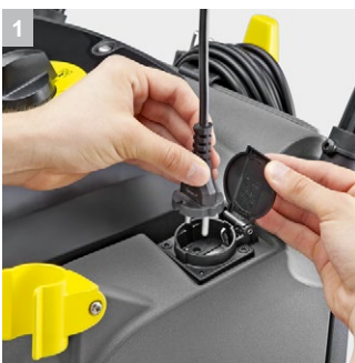
1 Штепсельная розетка для PW 30/1

Профессиональный ковромоечный экстрактор Puzzi 30/4. Реализован на основе новой вертикальной концепции с инновационной насадкой для пола. Сочетает в себе мобильность и высокую производительность. Отличается низким уровнем шума, эргономичным и простым управлением. Модель незаменима для глубокой чистки всех видов ковровых покрытий и текстильной обивки мягкой мебели.