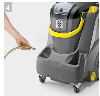
4 Вместительные баки для воды