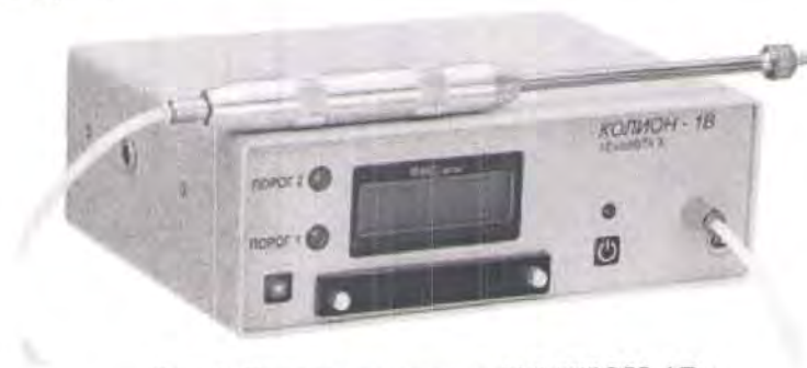
Рис.1 Газоанализатор «КОЛИОН-1В»

Оценка сорбционной способности фильтров ФУС-«КРОНТ» по общей загрязненности воздуха операционного отделения органическими соединениями основной и кислотной природы проведена с помощью газоанализатора «КОЛИОН-1В» (рис.1), зав №291-И, производитель ООО бюро аналитического приборостроения «ХРОМДЕТ-ЭКОЛОГИЯ», Россия (свидетельство о проверке №083364850 от 30.06.2015г). Газоанализатор предназначен для измерения суммарной концентрации вредных веществ в воздухе.