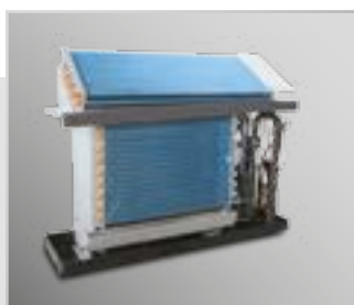
Специальное покрытие теплообменника Blue Fin полностью защищает от коррозии