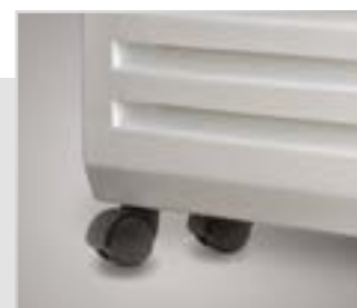
Мобильные шасси для напольной установки и транспортировки в комплекте