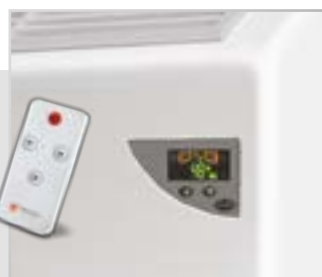
Удобное управление на корпусе и пульт ДУ