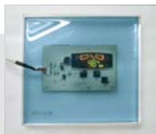
Влагостойкий контроллер со встроенным гигростатом