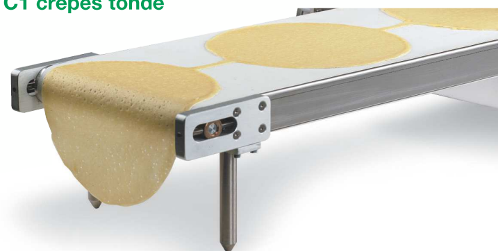
2 Particolare rullo riscaldatore C1 crêpes tonde