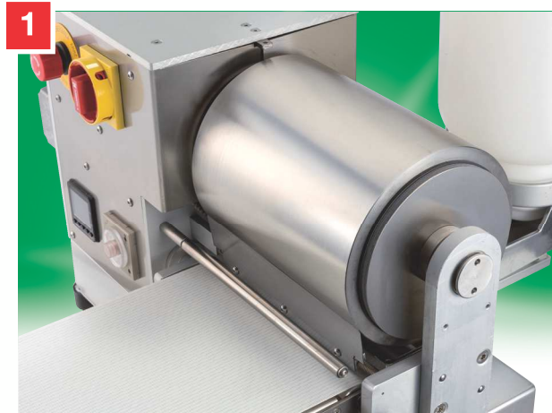
Formati rulli crêpes rettangolari: 160 mm e 200 mm