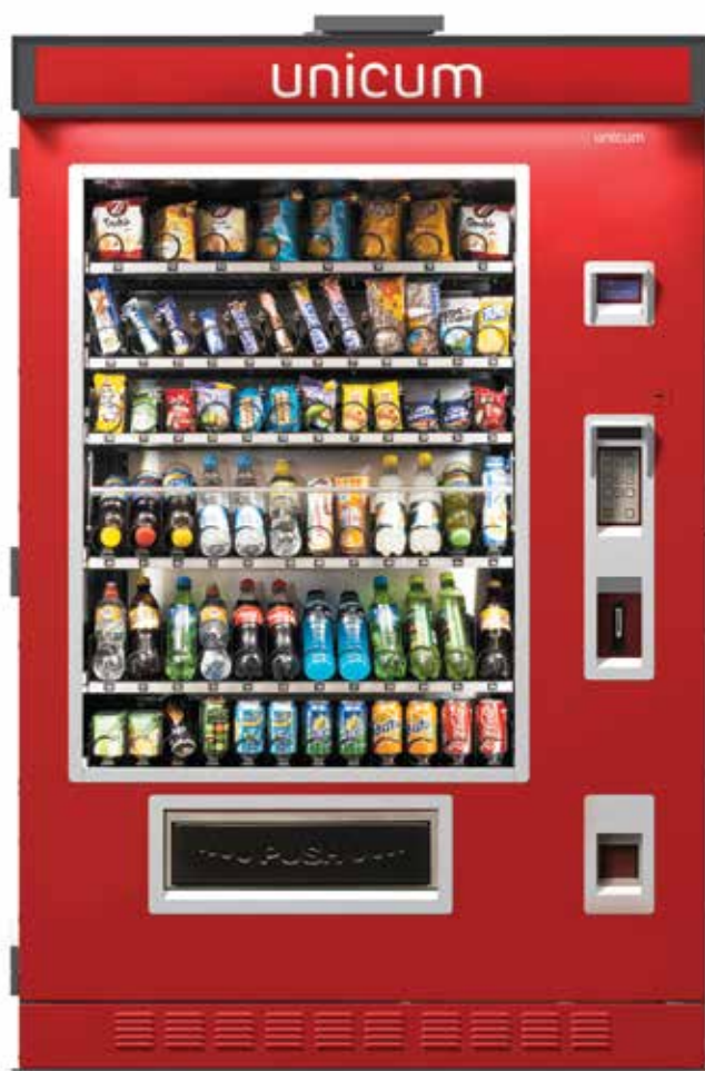
FOODBOX STREET LONG