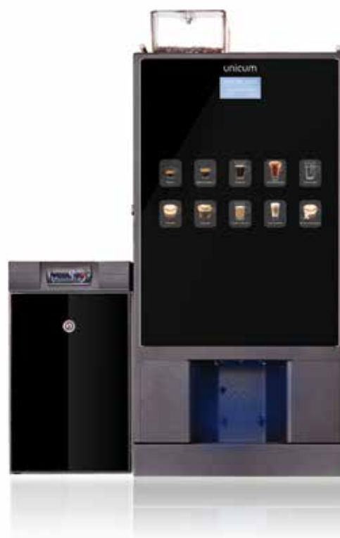
NERO FRESH MILK