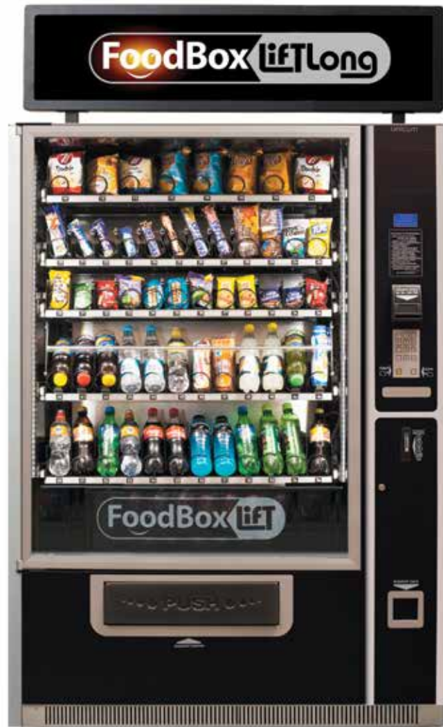
FOODBOX LIFT LONG

Снековый торговый автомат с системой лифтовой выдачи - одна из популярных и востребованных тенденций в современном вендинге. Лифт позволяет продавать те товарные группы, которые ранее невозможно было реализовывать с помощью торговых автоматов. Лифтовая модификация FOODBOX LIFT позволяет продавать хрупкие товары даже с верхней полки. Вы будете удивлены, как быстро и надежно работает FOODBOX LIFT - для того, чтобы выдать товар с самой верхней полки, ему нужно всего 6 секунд. За счет сокращения количества механических деталей и простоты конструкции лифта мы существенно повысили надежность его работы, обеспечив быструю и безопасную выдачу товара. При программировании автомата оператор может задать срок годности продукта, по истечении которого товар будет заблокирован в ячейке.