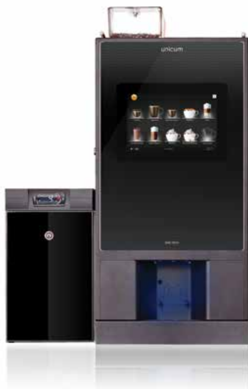
NERO FRESH MILK TOUCH

Регулируемая температура пара и воды позволит идеально настроить вкус и консистенцию напитков. NERO Fresh Milk - идеальное решение для премиального сегмента кофе-сервиса.