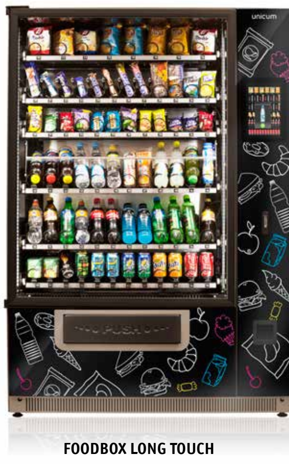
FOODBOX LONG TOUCH

FoodBox Touch – новейшая разработка компании UNICUM. Особенность FoodBox Touch – 11-дюймовый тачскрин дисплей, значительно расширяющий возможности этого снекового автомата. Благодаря интуитивно понятному интерфейсу уходят в прошлое неудобные номера ячейек, в которых непросто разобраться покупателю. Теперь весь ассортимент автомата представлен на экране. Потребитель легко выбирает и оплачивает нужный продукт.