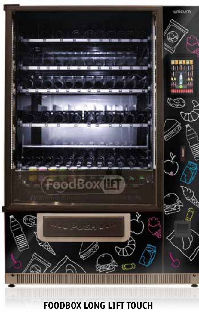
FOODBOX LONG LIFT TOUCH

FoodBox Lift Touch – флагманская модель снекового автомата UNICUM. Особенность FoodBox Lift Touch – 11-дюймовый тачскрин дисплей, значительно расширяющий возможности этого снекового автомата, а также лифтовая система выдачи продукта. Благодаря интуитивно понятному интерфейсу уходят в прошлое неудобные номера ячейек, в которых непросто разобраться покупателю. Теперь весь ассортимент автомата представлен на экране.