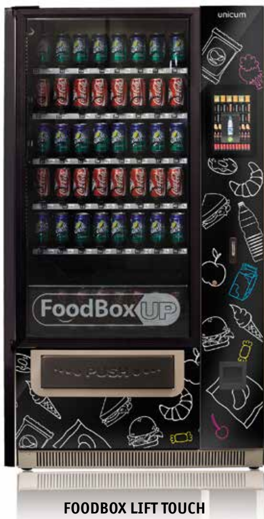
FOODBOX LIFT TOUCH